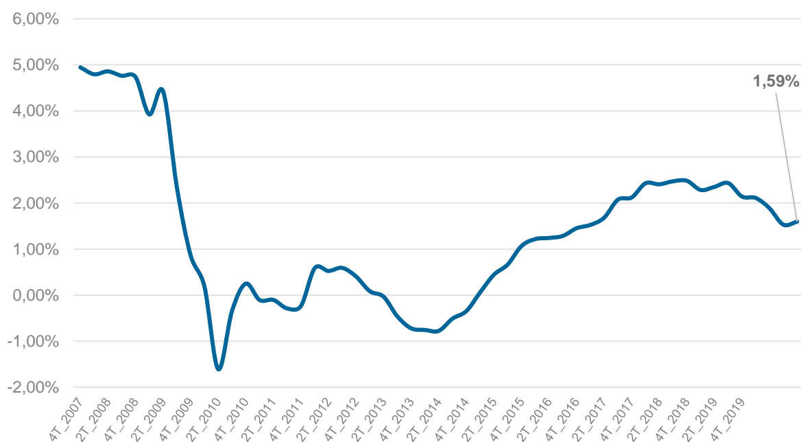
Tabla/Gráfico 1: Evolución de tasa interanual del parque móvil asegurado (1T 2007-1T 2020).