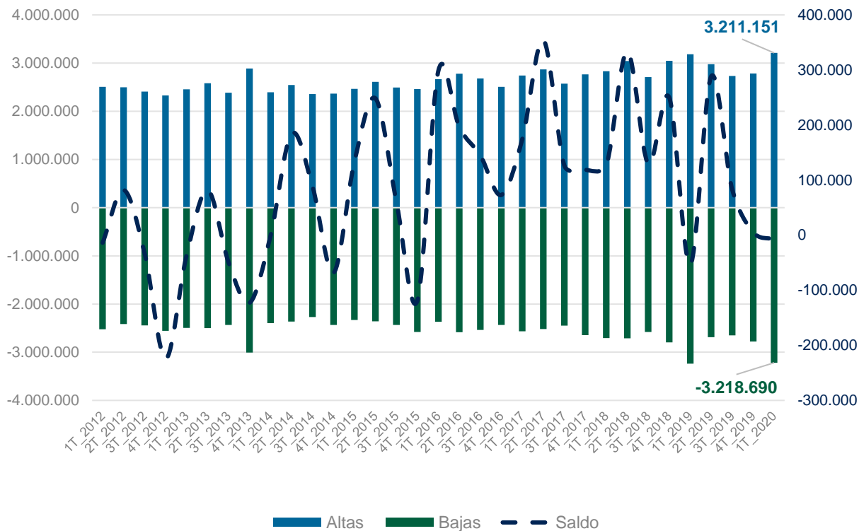
Tabla/Gráfico 4: Histórico de altas y bajas (1T 2012-1T 2020).