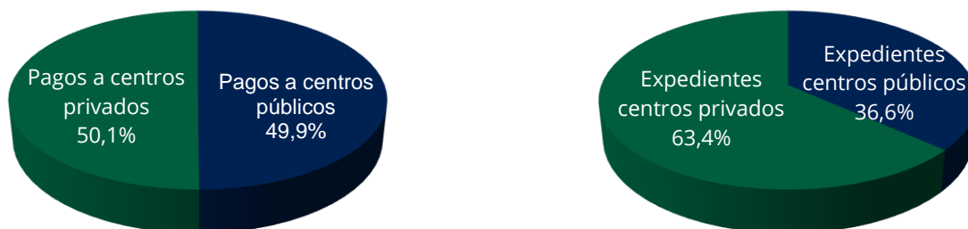
Ilustración/Tabla 1: Distribución de los pagos y expedientes de CAS, por ámbitos