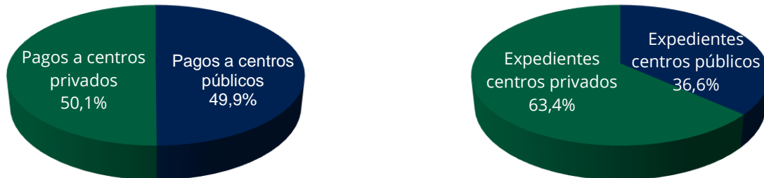
Ilustración/Tabla 1: Distribución de los pagos y expedientes de CAS, por ámbitos